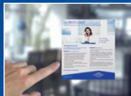
SGG BIOCLEAN-Etikett auf der Beschichtung

Dasselbe gilt, wenn das Glas längere Zeit durch Fensterläden oder Rollläden verdeckt war.