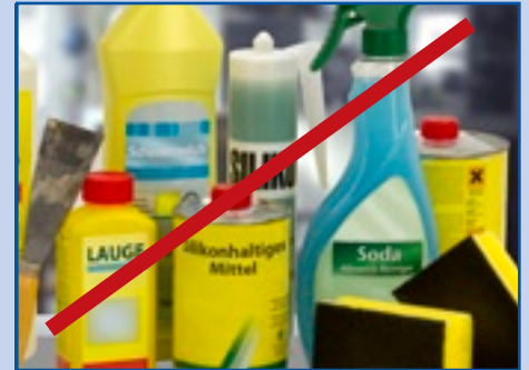
Keine aggressiven Werkzeuge oder Mittel verwenden!