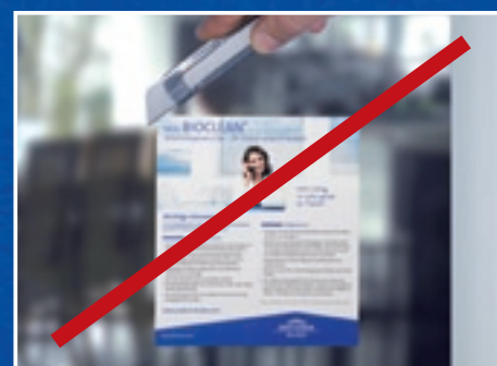
Etikett nicht mit metallischen Gegenständen abkratzen!